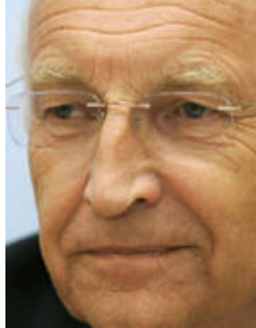
Edmund Stoiber lehnt Änderungen am Entwurf ab.

Der stellvertretende SPD-Fraktionsvorsitzende Kelber sieht breite Unterstützung für seine Forderung nach Korrekturen an dem Entwurf. "Die Kritik geht von Greenpeace bis zum Bundesverband der deutschen Industrie und die meisten Experten auch aus den Bundesländern und dem Bundestag haben diese Kritik aufgenommen und wollen eine Veränderung", sagt Kelber.