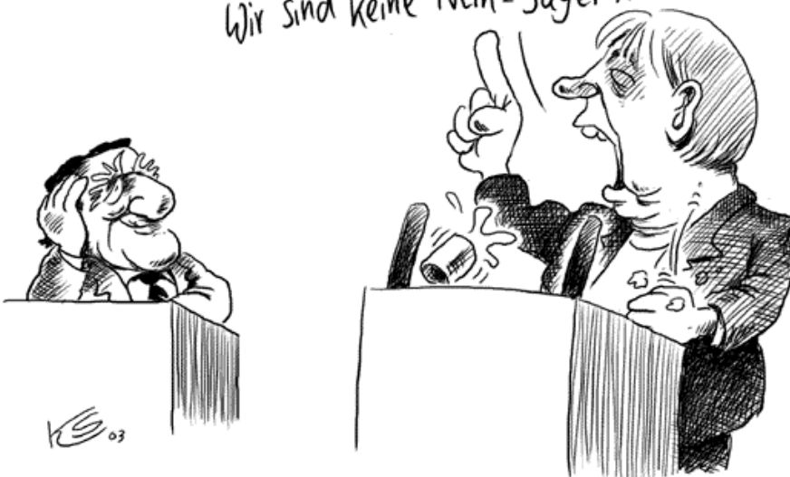
Karikatur: Klaus Stuttmann, Der Tagesspiegel

Nein! Nein! Nein! Nein! Wir sind keine Nein-Sager!!