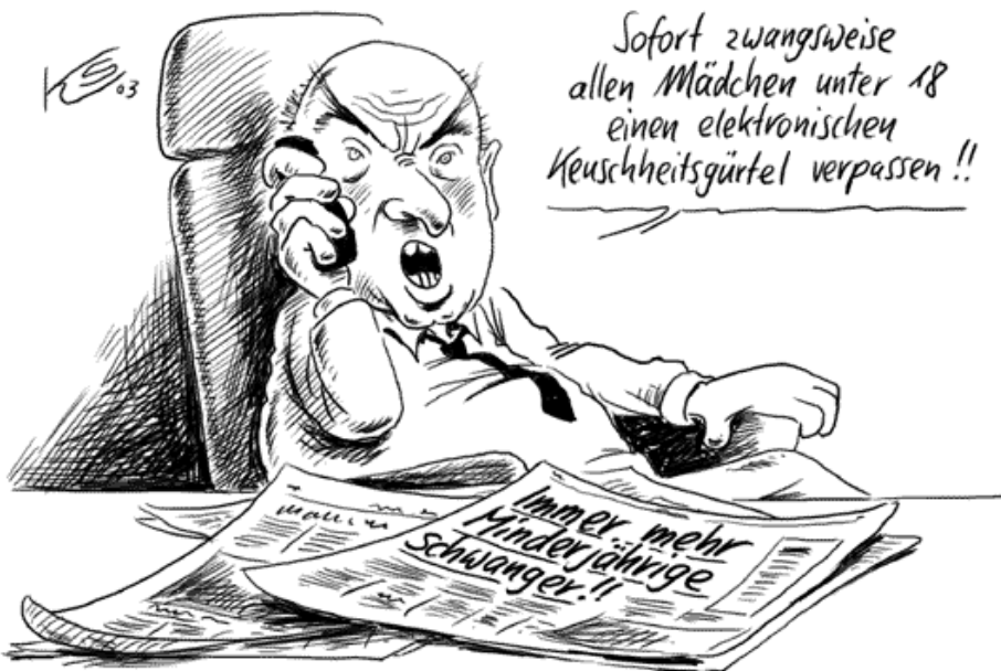
„Kommunalwahlkampf Brandenburg à la Schönbohm“