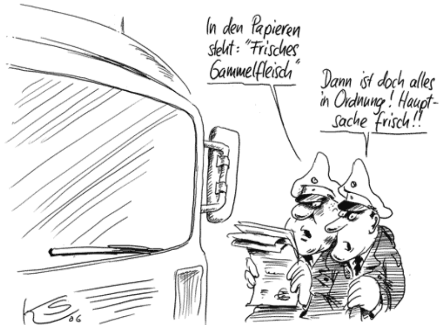
Karikatur: Klaus Stuttmann

Die Texte der Seiten 2-4 stammen vom Pressezentrum des Bundestages und der SPD-Bundestagsfraktion.