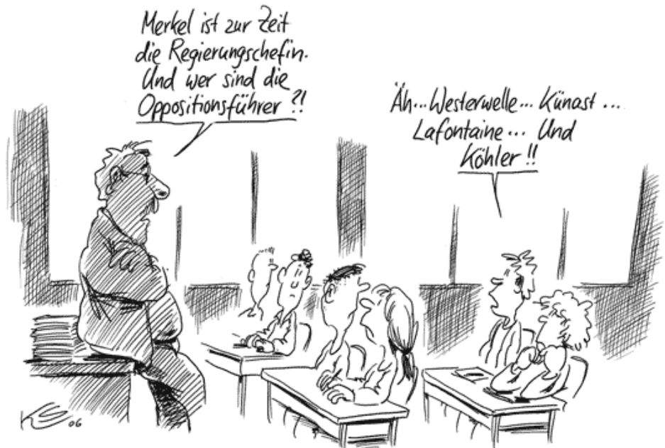
Karikatur: Klaus Stuttmann

Die Texte der Seiten 2-4 stammen vom Pressezentrum des Bundestages und der SPD-Bundestagsfraktion.