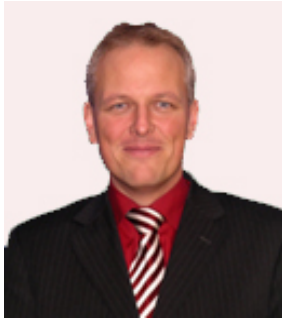
Ulrich Kelber Bonns Bundestagsabgeordneter