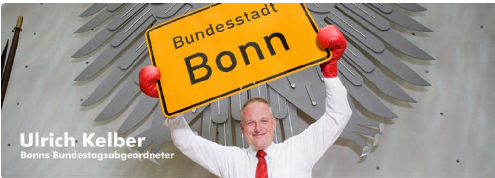
Ulrich Kelber Bonns Bundestagsabgeordneter