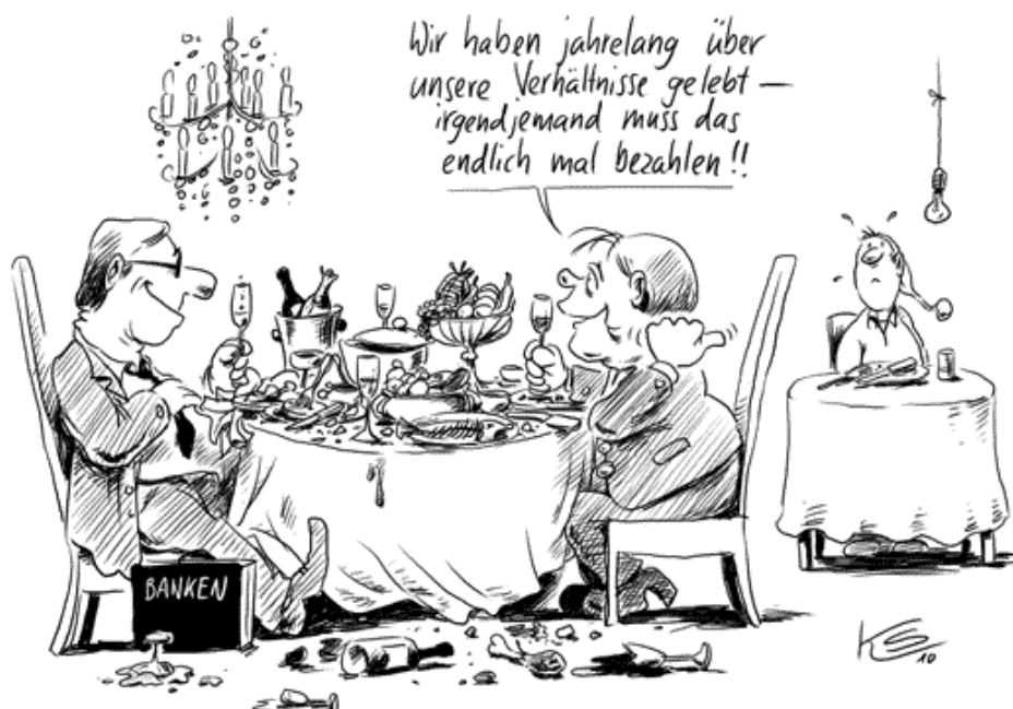
Karikatur: Klaus Stuttmann