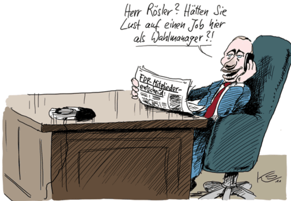
Karikatur: Klaus Stuttmann